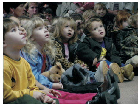
Данетки для детей на стр. 5

И для развития ума полезнее, чем сомнительный батончик с белками нугой и орехами.